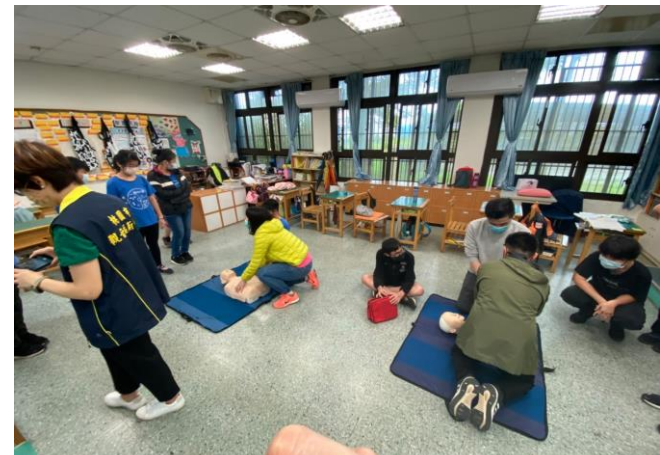
說明：六年級簡易急救訓練