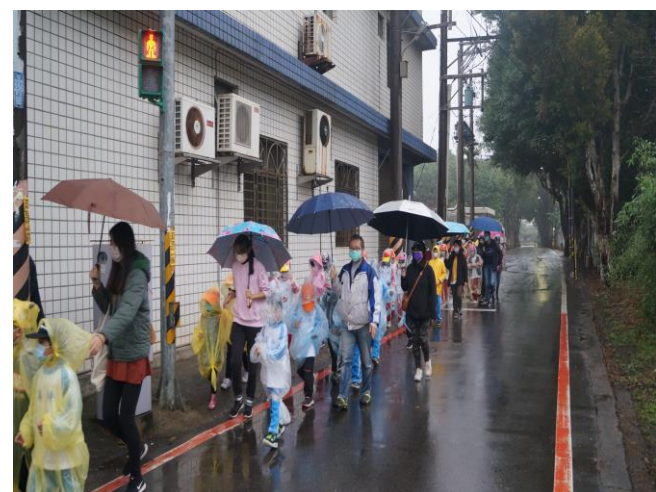
說明：路跑(健走)暨交通安全體驗