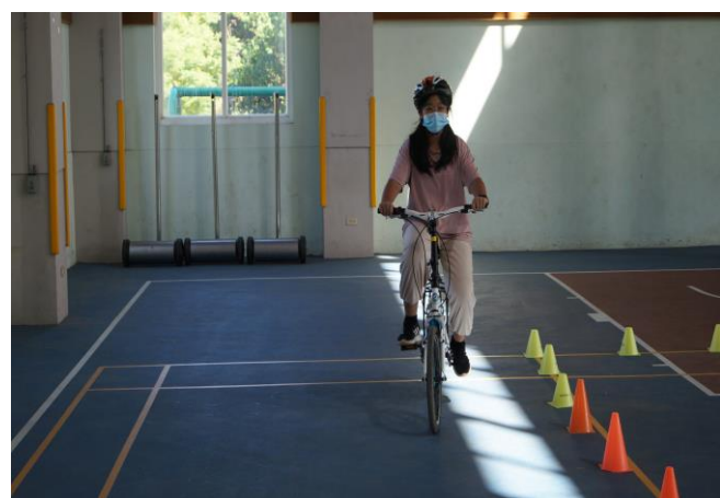
說明：五年級自行車檢定