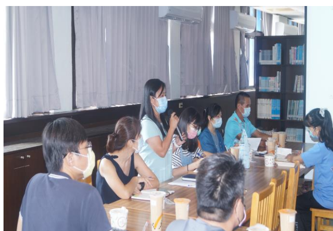
說明：行程後檢討會議