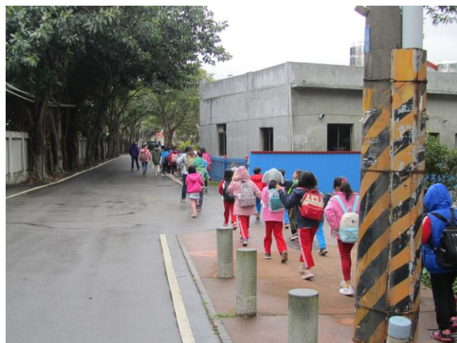
說明：二年級認識社區交通狀況