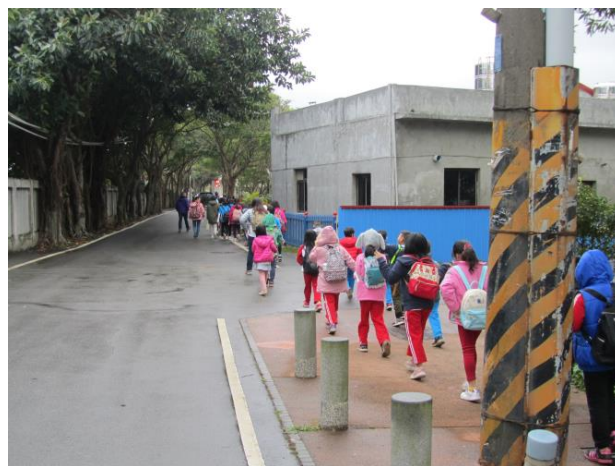
說明：社區環境踏查