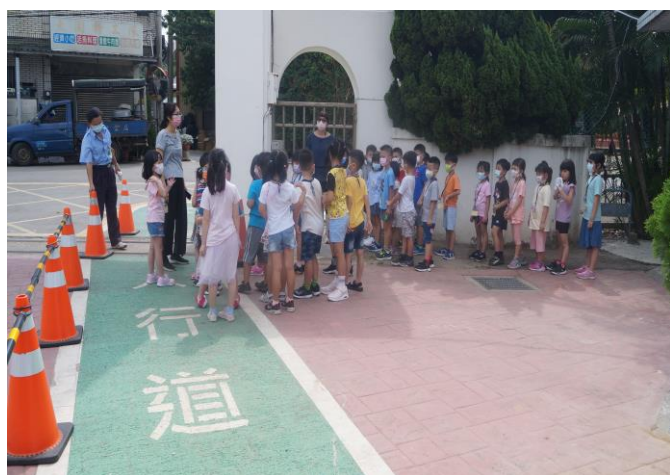
說明：小學新生活-交通安全