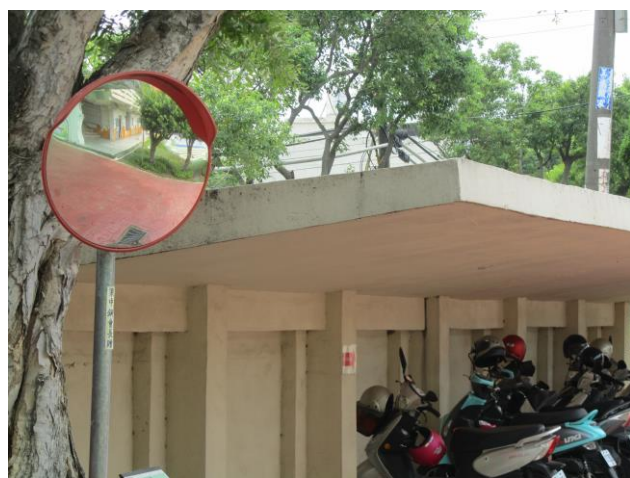
說明：校內設置反光鏡