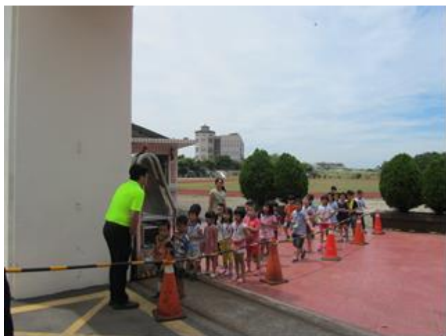
說明：一年級路隊訓練