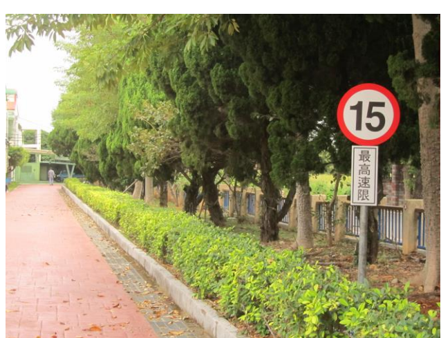
說明：校內依情境設置安全標誌